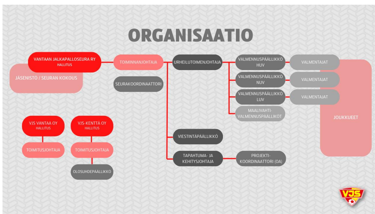
KUVA 1. VJS ORGANISAATIOMATRIISI

Hänen tukena toimivat seuran parikymmenpäinen ammattilaisorganisaatio, lukuisat huippuosaavat oto-, sivu- ja vapaaehtoistoimiset työntekijät sekä hallitus.