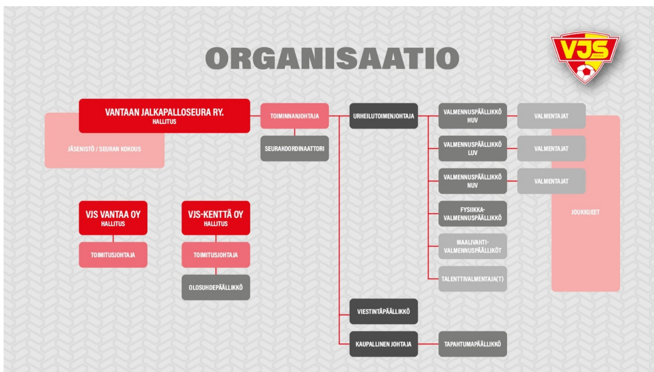
Kuva 2. VJS:n organisaatiorakenne 1.11.2023 alkaen.