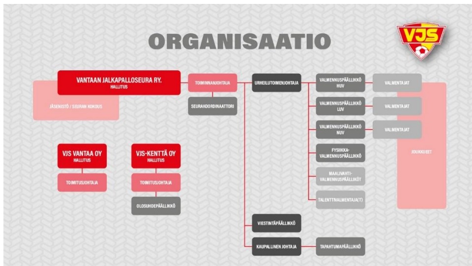
KUVA 3. VJS ORGANISAATIOMATRIISI 1.11.2023 ALKAEN